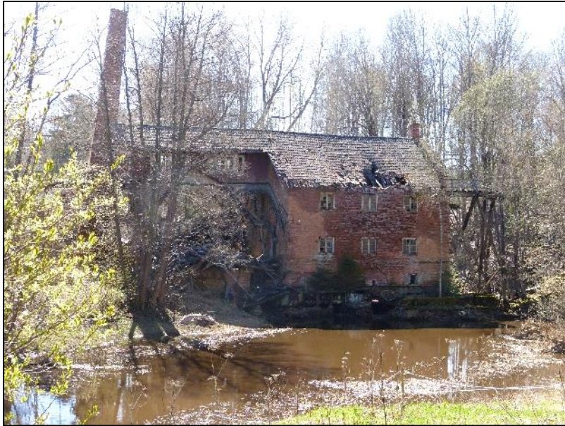
Kvarnen i Norr Hårsbäck 2018

Kvarnbyggnaden finns ännu kvar men i fallfärdigt skick. Ett fall från tredje våningen i denna byggnad tycks innebära en avsevärd höjd. Det är lätt att inse att det kunde förorsaka dödliga skador.