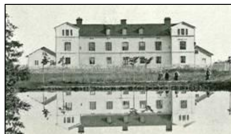
Samtidsfoto på Sala lasarett